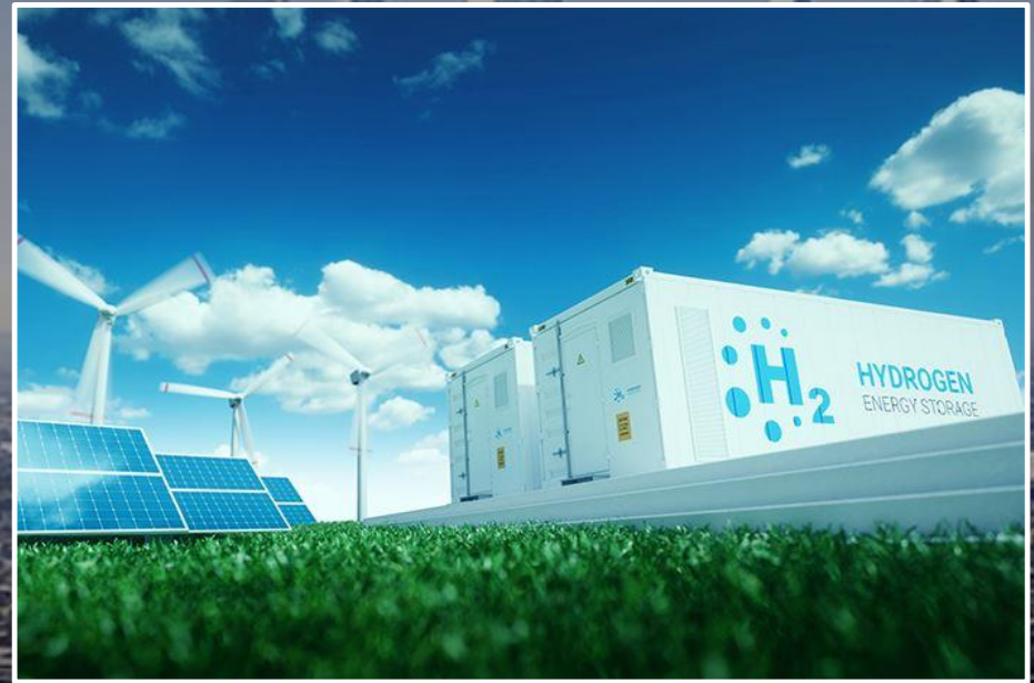
제주 그린수소 글로벌허브 구축